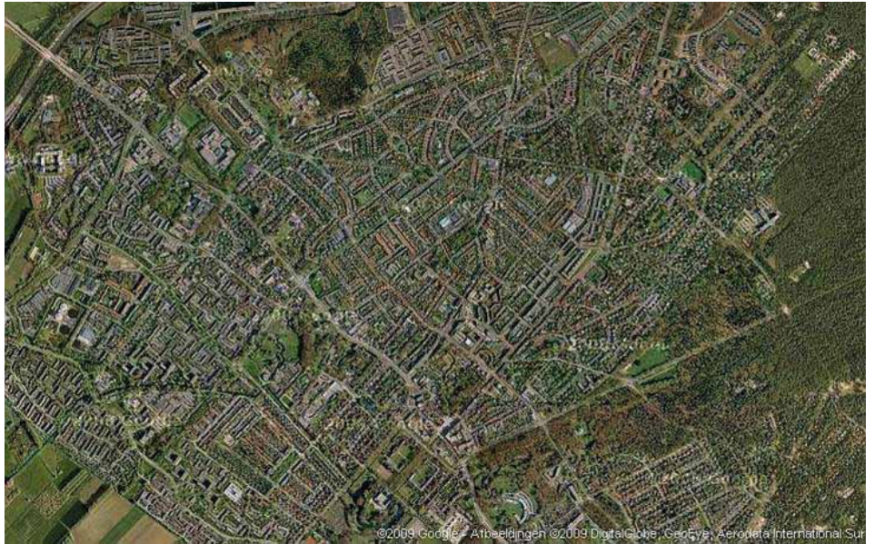
Luchtfoto laat zien hoe groen Zeist is.