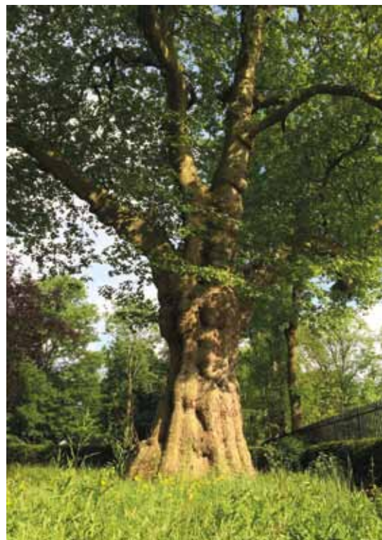
Plataan in de gemeente Leidschendam-Voorburg.